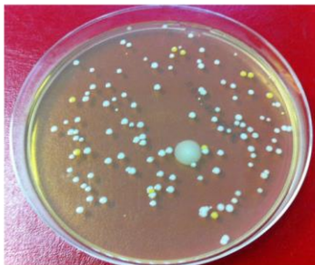
Masque communément utilisé dans les hôpitaux.

Après avoir été porté pendant 30 minutes, la surface externe d'un masque standard et du masque chirurgical et médical TrioMed TM Actif ont été testée pour évaluer la contamination bactérienne de chacun.